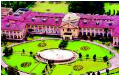
पटना उच्च न्यायालय

क्या विभिन्न स्तरों की ये अदालतें एक-दूसरे से जुड़ी हुई हैं? जी हाँ। भारत में हमारे पास एकीकृत न्यायिक व्यवस्था है। इसका मतलब यह है कि ऊपरी अदालतों के फैसले नीचे की सारी अदालतों को मानने होते हैं। इस एकीकरण को समझने के लिए अपील की व्यवस्था को देखा जा सकता है। अगर किसी व्यक्ति को ऐसा लगता है कि निचली अदालत द्वारा दिया गया फैसला सही नहीं है, तो वह उससे ऊपर की अदालत में अपील कर सकता है।