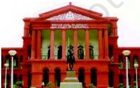
कर्नाटक उच्च न्यायालय