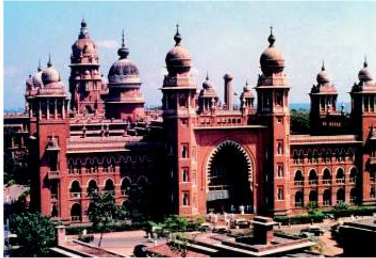
मद्रास उच्च न्यायालय

उच्च न्यायालयों की स्थापना सबसे पहले 1862 में कलकत्ता, बंबई और मद्रास में की गई ये तीनों प्रेसिडेंसी शहर थे। दिल्ली उच्च न्यायालय का गठन 1966 में हुआ। आज देश भर में 24 उच्च न्यायालय हैं। बहुत सारे राज्यों के अपने उच्च न्यायालय हैं जबकि पंजाब और हरियाणा का एक साझा उच्च न्यायालय चंडीगढ़ में है। दूसरी तरफ चार पूर्वोत्तर राज्यों असम, नागालैंड, मिजोरम और अरुणाचल प्रदेश के लिए गुवाहाटी में एक ही उच्च न्यायालय रखा गया है। आंध्र प्रदेश और तेलंगाणा का एक साझा उच्च न्यायालय हैदराबाद में है। ज्यादा से ज्यादा लोगों के नज़दीक पहुँचने के लिए कुछ उच्च न्यायालयों की राज्य के अन्य हिस्सों में शाखाएँ भी हैं।